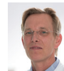
Dr. med. Alexander Burges Klinik und Poliklinik für Frauenheilkunde und Geburtshilfe, Klinikum der Universität München Marchioninstr. 15, 81377 München